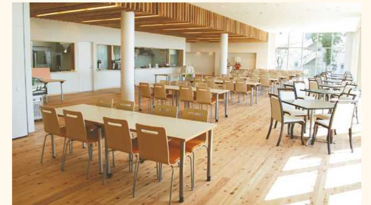
■レストラン 杉 赤身 節有のハードフローリング