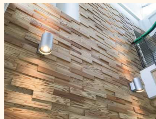
■消防署(壁:準不燃材、厚みをかえて立体的に)