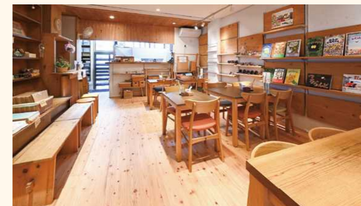
■ドックカフェ 杉 赤身 節有の衝撃吸収フローリング(土足対応)