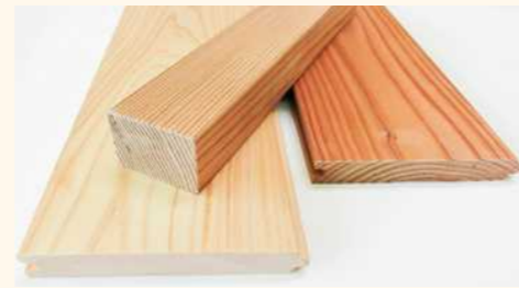
■不燃、準不燃の部材

大規模施設・公共施設の法令にも対応した防火木材です。法的な規制により利用が制限されていた「木材」が、公共建築物や医療・福祉機関、高層マンション、店舗等で安全に、安心して使えるようになります。ホーテックの不燃木材は、表面に浮き出した薬剤が結晶化して白くなる「白華現象」をほぼ解消した「白華抑制不燃木材」です。不燃木材を通じて木造建築の可能性を大きく広げていきたいと考えています。