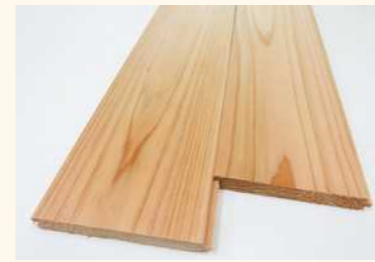
■熱処理木材の部材