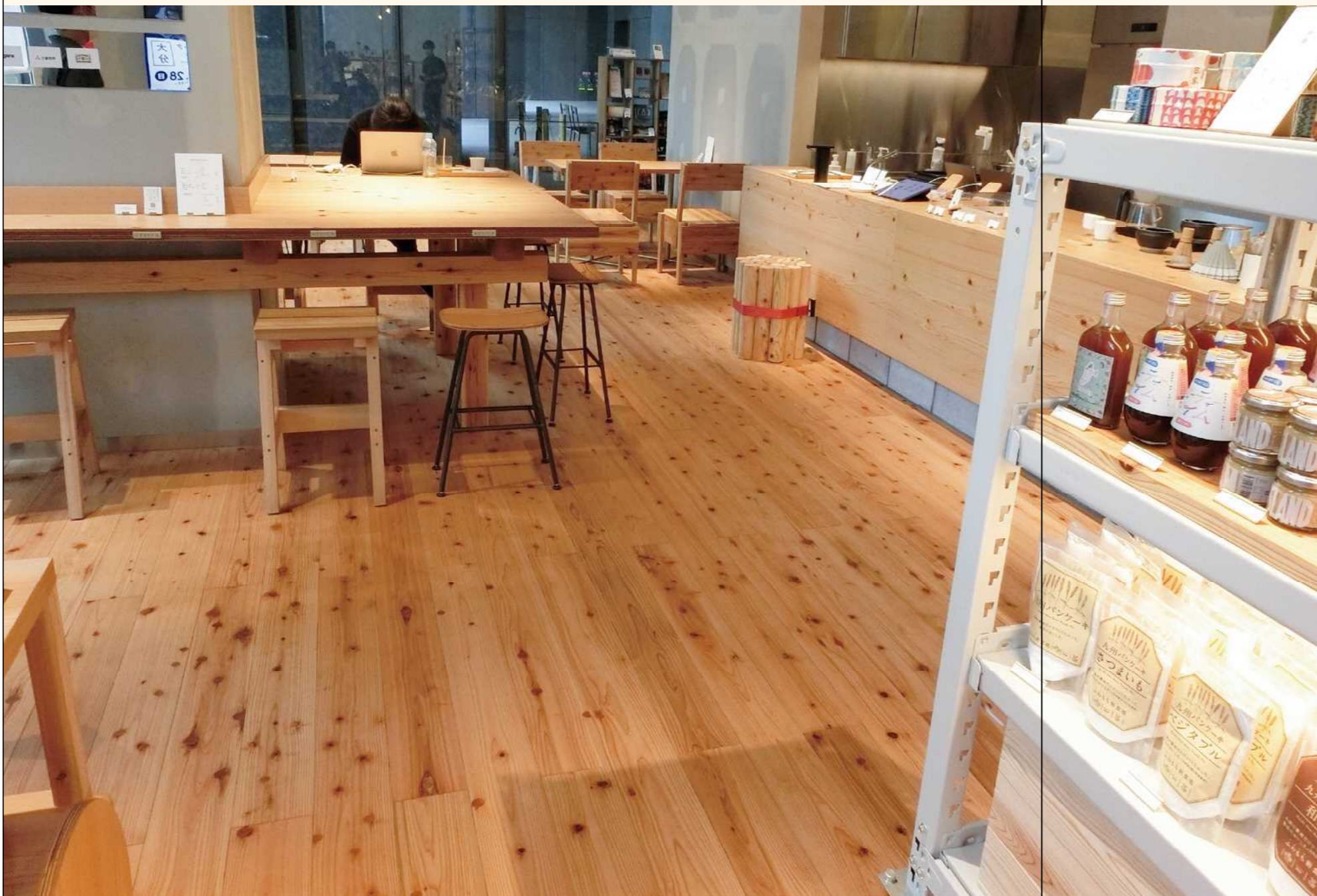
■ショップ 杉 赤身 節有のハードフローリング