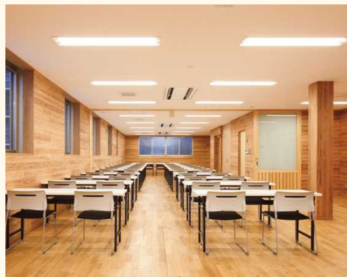
■社会福祉法人会議室(壁:準不燃材)