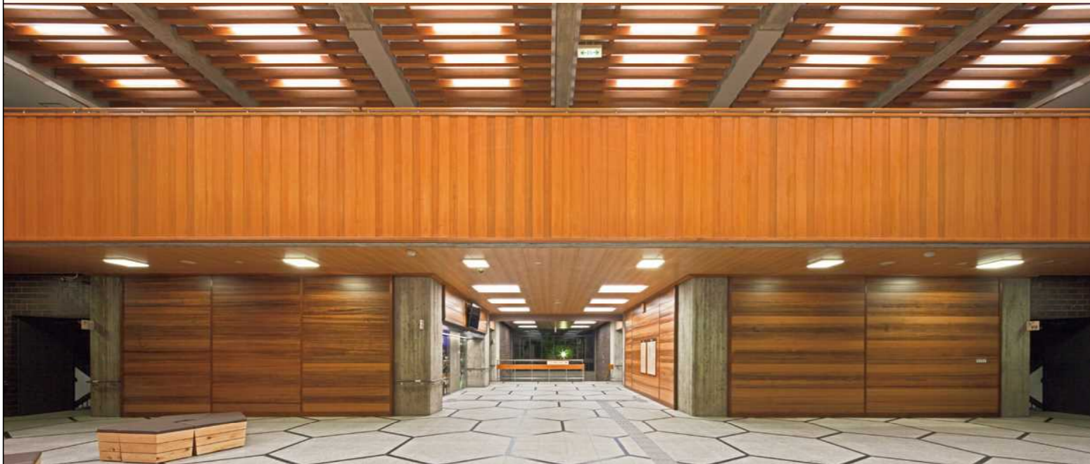
■公共施設(壁:不燃材)

木製品の腐り・寸法の安定性をより高めるための木材処理技術です。高温の水蒸気(220℃)で熱処理することによって、腐朽菌の影響が減少するため耐朽性が上がり、含水率が10%以下になることで寸法安定性がいっそう向上します。ルーバー・羽目板などの外装材や軒天、ウッドデッキなど、特に屋外への木材利用に最適です。水蒸気と熱のみで処理するため、薬品を全く使用しておらず、室内外問わず利用できる「環境に優しい材料」です。