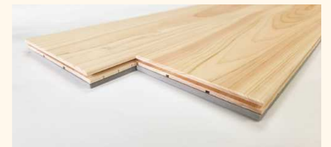
■衝撃吸収フローリングの部材