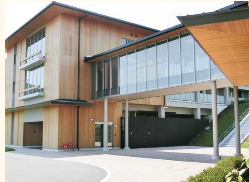
■外壁、ルーバー施工例